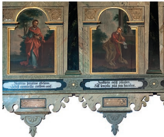
Les peintures sur le parapet de la galerie montre les apôtres qui sont morts en martyrs. Le peintre des églises Jonas Bergman a fait les portraits en 1757.