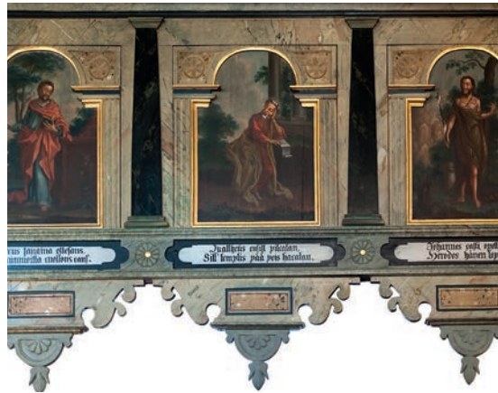
Die Bilder rings um die Empore stellen die Apostel samt den Texten über ihren Märtyrertod dar. Die Bilder wurden im Jahr 1767 vom Kirchenmaler Jonas Bergman gemalt.